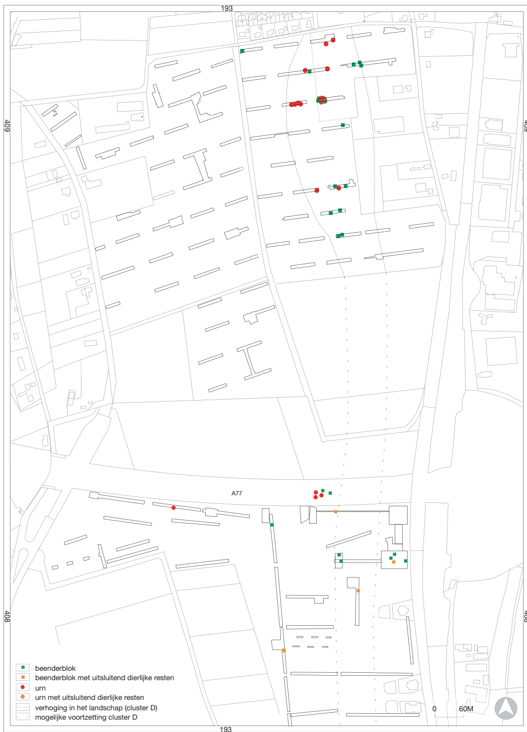
Afb. 10 Verspreiding van de aangetroffen graven in het gewaardeerde deel van het plangebied en een mogelijke voortzetting naar het zuiden (zie voor een kleurenversie van deze afbeelding de bijlage afbeeldingen kleur achterin).