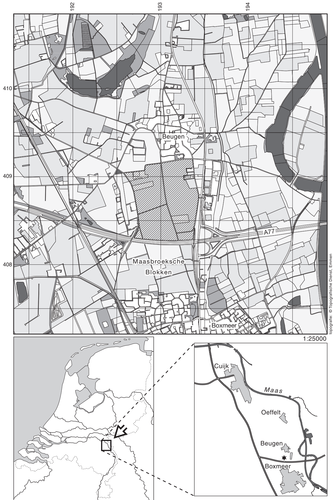
Afb. 1 Ligging van het plangebied Sterckwijk (gemeente Boxmeer).