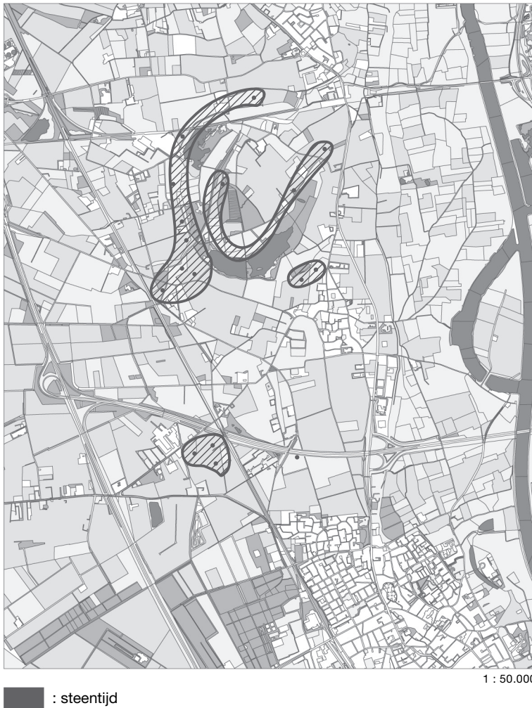
Afb. 4 Verspreidingsbeeld van sporen van bewoning uit de Steentijd.