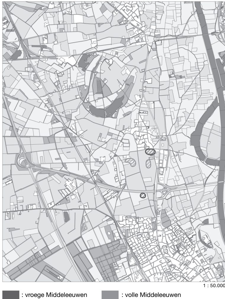
Afb. 9 Verspreidingsbeeld van sporen van bewoning uit de vroege en volle Middeleeuwen.

in het zuidoostelijk deel van het aandachtsgebied, ten westen en oosten van de Heerstraat, een Romeinse weg, zijn duidelijke aanwijzingen voor nederzettingen en grafvelden (afb. 8). Zo leverde het AMR-onderzoek in november 2001 op het wettelijk beschermde terrein Boxmeer-De Kater vier crematiegraven op. 41 Het proefsleuvenonderzoek van 2003 heeft weinig aanwijzingen voor bewoning in de Romeinse tijd opgeleverd. Het gaat om slechts één kuil in het zuidwestelijk deel. In het zuidelijk deel van het onderzoeksgebied troffen de opgravers een vreemd verschijnsel aan, namelijk een zone - aangeduid als cluster F - met grote hoeveelheden Romeins schervenmateriaal (in totaal bijna tien kilo) en enkele stukken bouwpuin. 42