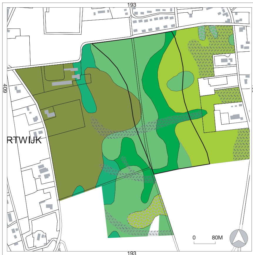
Afb. 3 Landschapseenheden en grenzen van verbruining in het plangebied (zie voor een kleurenversie van deze afbeelding de bijlage afbeeldingen kleur achterin).